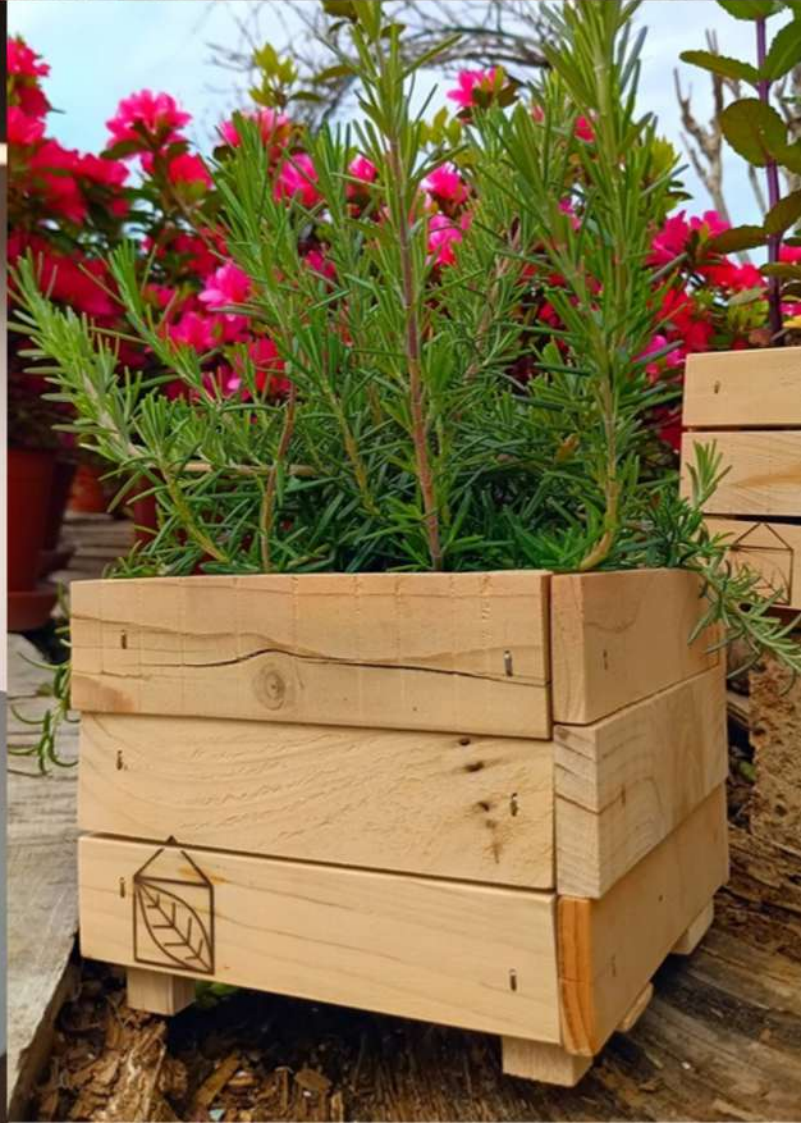
Alcuni dei tanti prodotti della Falegnameria Sociale San Lorenzo